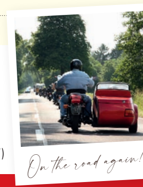
On the road again!