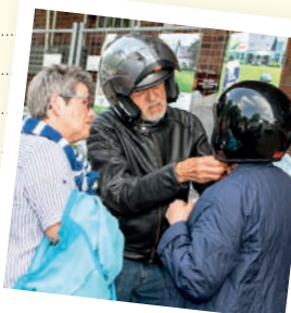
Passat, wackelt und hat Luft?