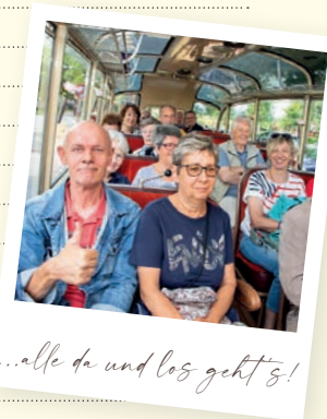
...alle da und los geht's!