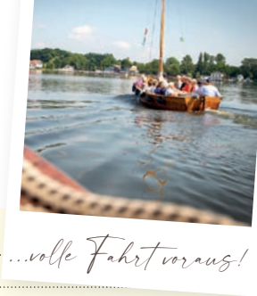
...volle Fahrt voraus!