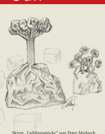
Skizze „Lieblingsstücke“ von Peter Medzech