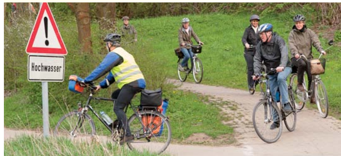
Feierabend Radtouren in Zusammenarbeit mit dem ADFC Kreisverband Minden-Lübbecke e.V. | Streckenlänge ca. 25 – 35 km

Abschlussradtour von Minden nach Petershagen